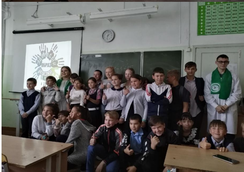
На внеурочном занятии ребята 5 класса приготовили рисунки для 1 класса по пожарной безопасности: